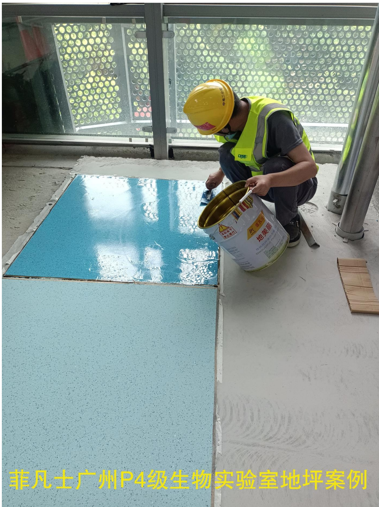
菲凡士广州P4级生物实验室地坪案例